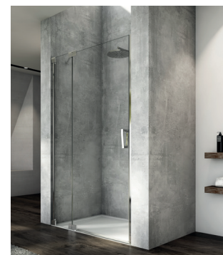
↑ CADURA Porte pivotante CA13 (Poli-brillant)