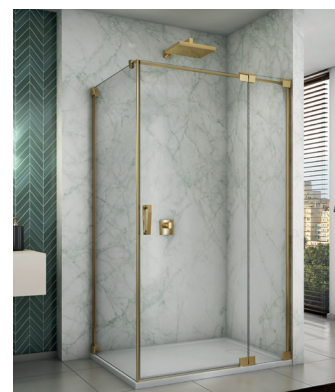
↑ Finition Gold