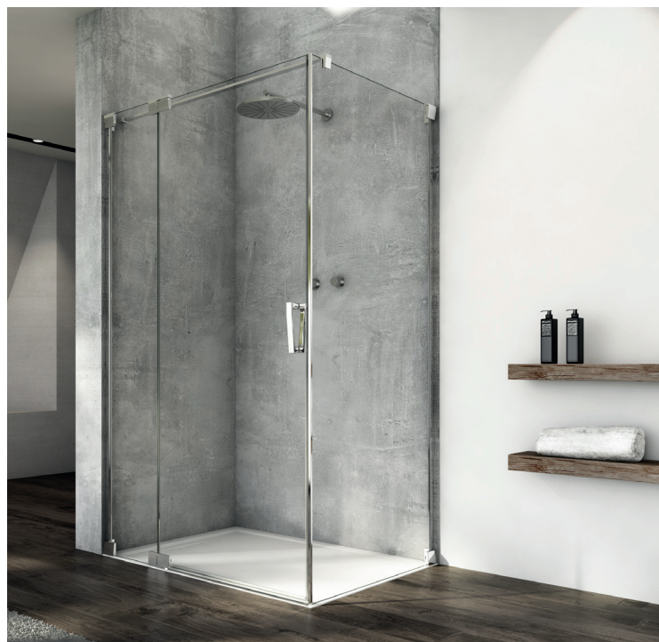
↑ CADURA Porte pivotante CA13 + paroi fixe à 90° CAT1 (Poli-brillant)

Livrée avec notice de montage et accessoires