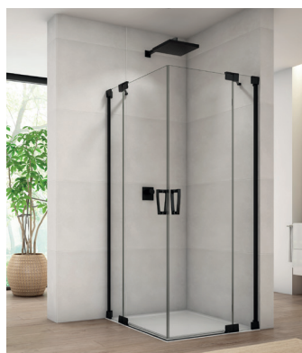
↑ Finition Noir mat