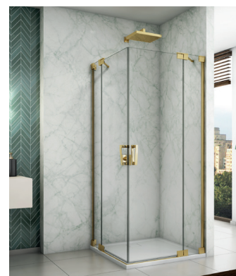
↑ Finition Gold