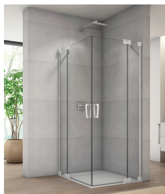
↑ Finition Blanc mat