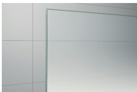
↑ Vitrage Shade