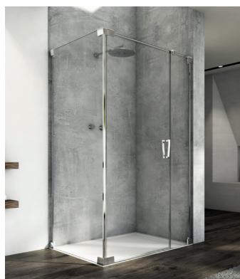
↑ Finition Poli-Brillant