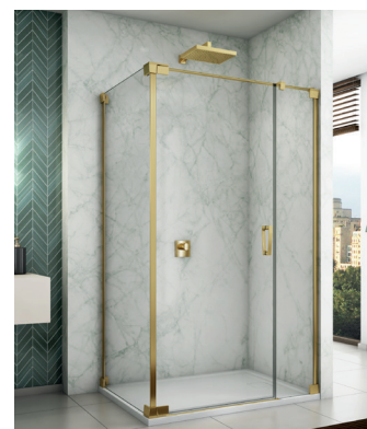
↑ Finition Gold