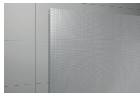
↑ Vitrage Screen