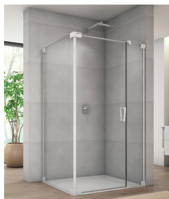
↑ Finition Blanc mat