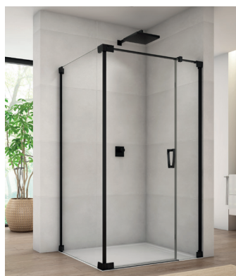
↑ Finition Noir mat