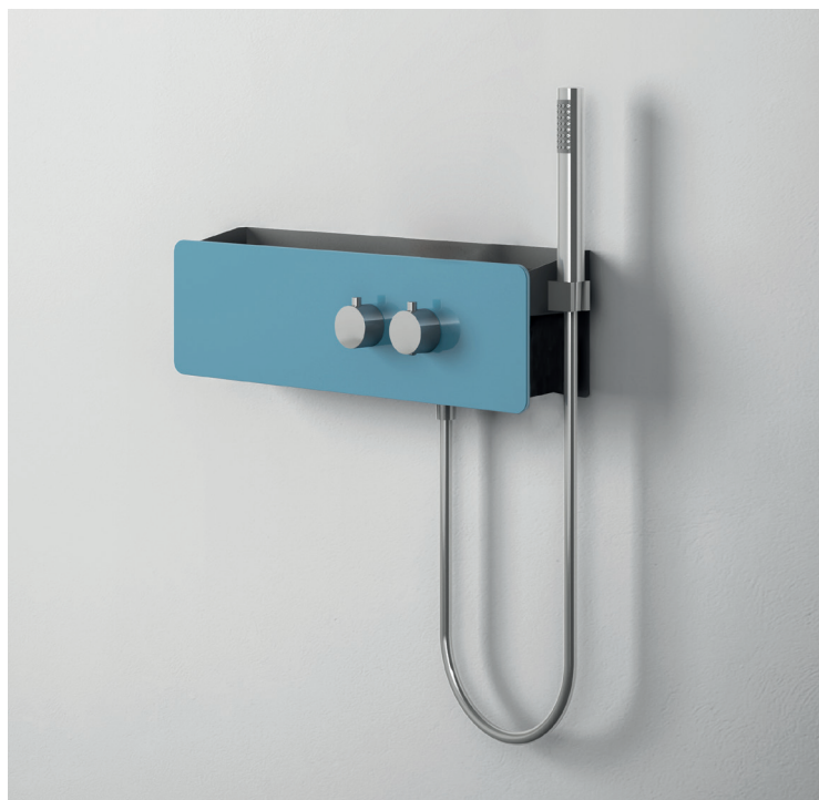
↑ AZULEJO Porte objet équipé UW00x01 (coloris verre Bleu)