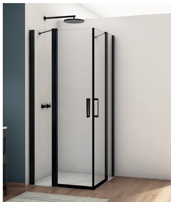
↑ Finition Noir mat