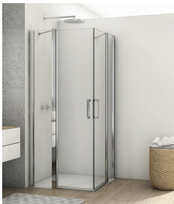
↑ Finition Poli-Brillant