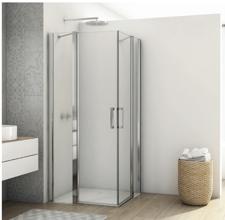
↑ DIVERA Accès d'angle pivotant 2 volets D22DE2B (Poli-brillant)

Livrée avec notice de montage et accessoires