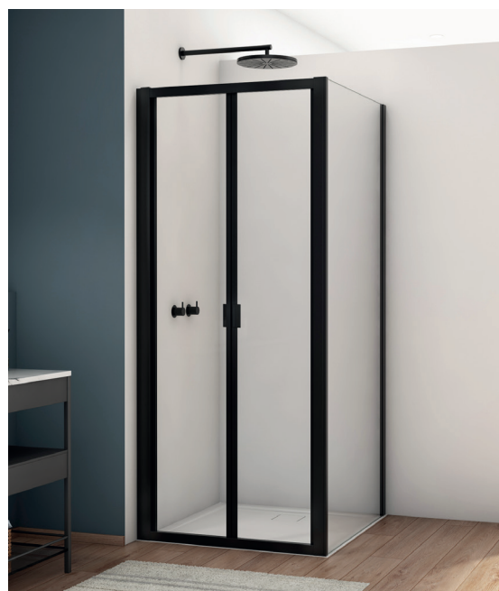
↑ Finition Noir mat