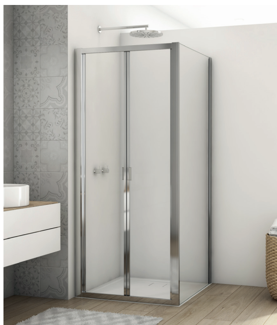
↑ Finition Poli-Brillant