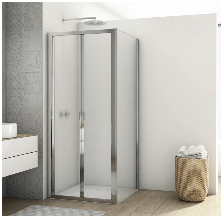
↑ DIVERA Porte repliable D22K + paroi fixe à 90° D22F1 (Poli-brillant)

Livrée avec notice de montage et accessoires