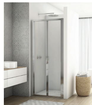
↑ DIVERA Porte repliable D22K (Poli-brillant)