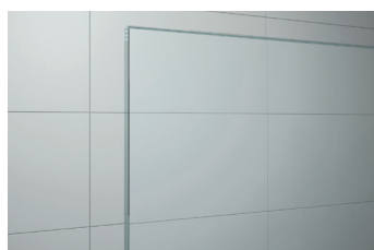
↑ Vitrage Transparent