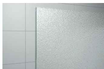
↑ Vitrage Granité