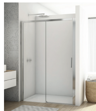
↑ DIVERA Porte coulissante 2 volets D22S2B (Poli-brillant)