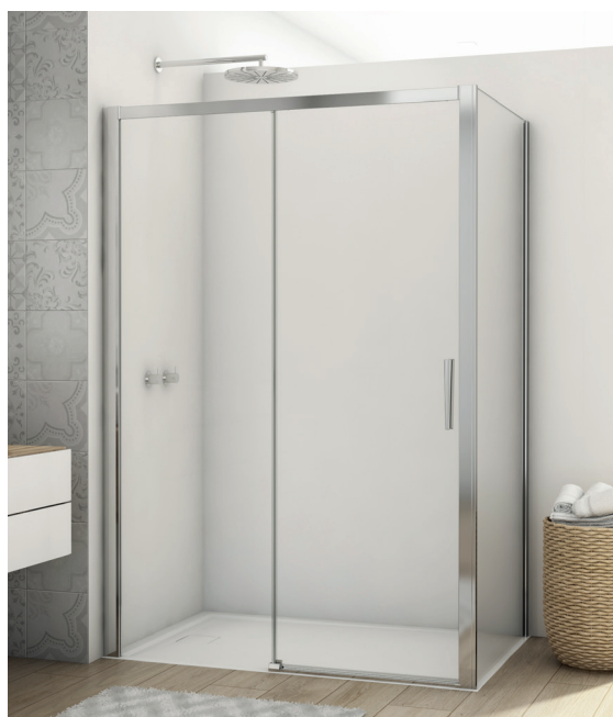
↑ Finition Poli-Brillant