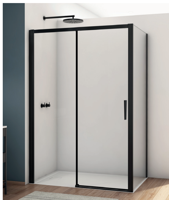
↑ Finition Noir mat