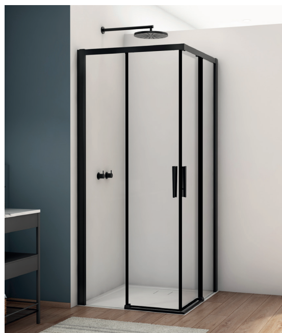
↑ Finition Noir mat