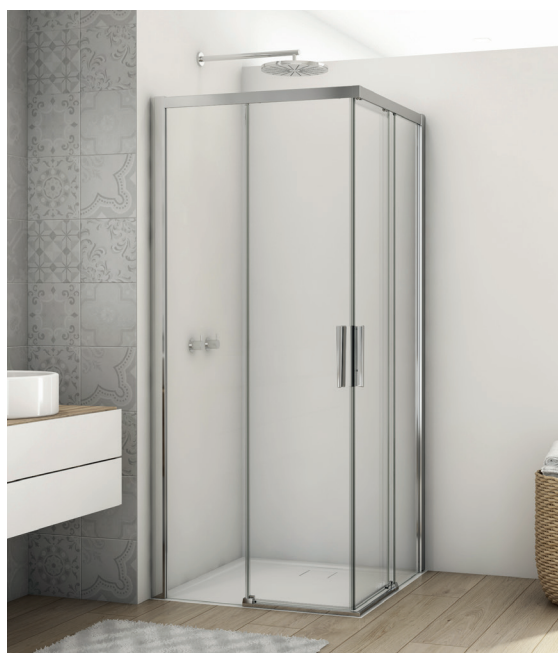
↑ Finition Poli-Brillant