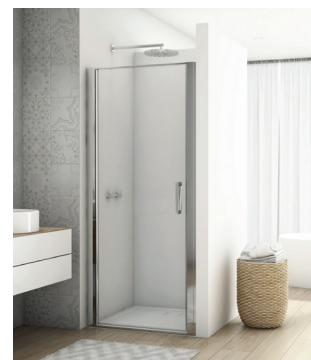
↑ DIVERA Porte pivotante D22T1 (Poli-brillant)