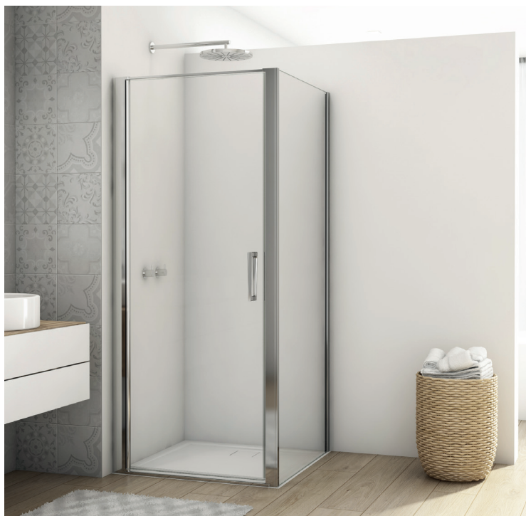
↑ DIVERA Porte pivotante D22T1 + paroi fixe à 90° D22F1 (Poli-brillant)

Livrée avec notice de montage et accessoires