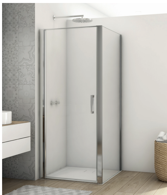
↑ Finition Poli-Brillant