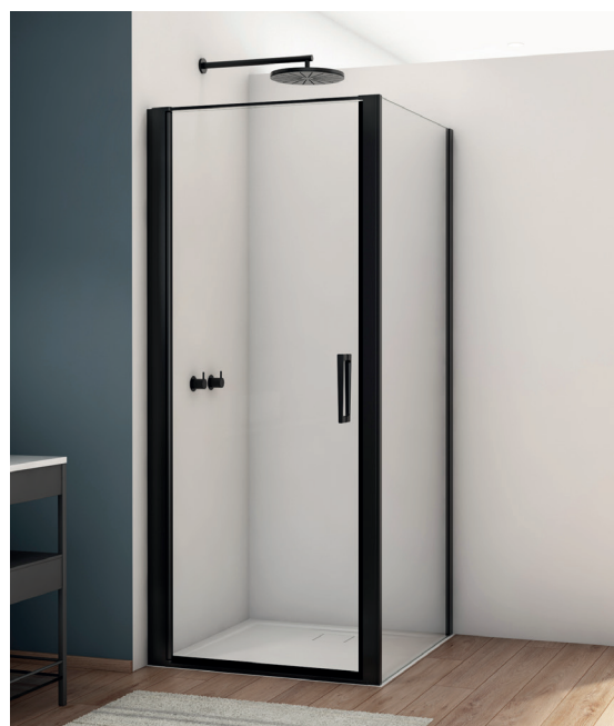
↑ Finition Noir mat