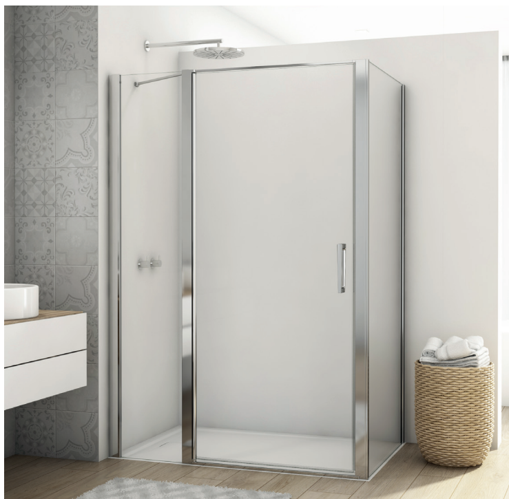
↑ DIVERA Porte pivotante et paroi fixe en ligne D22T13 + paroi fixe à 90° D22F1 (Poli-brillant)

Livrée avec notice de montage et accessoires