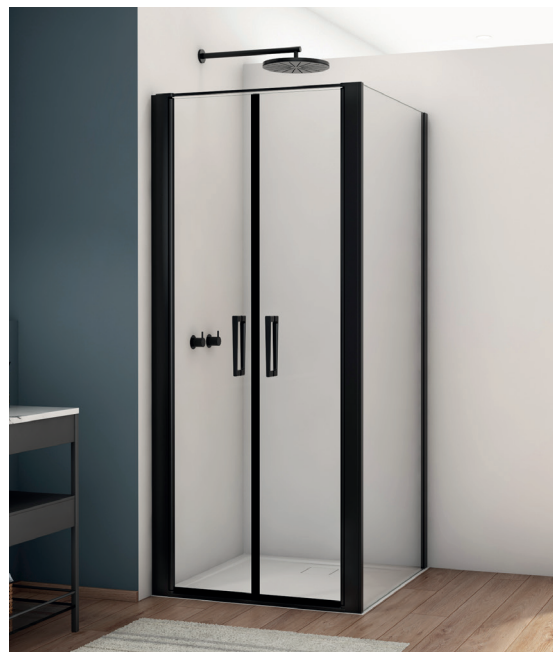
↑ Finition Noir mat