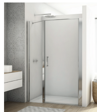
↑ DIVERA Porte pivotante avec fermeture sur paroi fixe en ligne D22T31 (Poli-brillant)