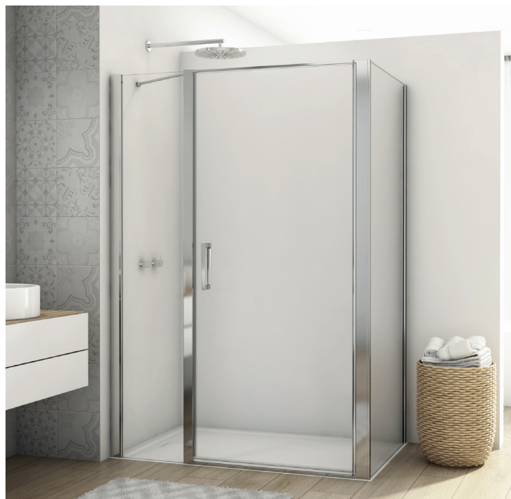
↑ DIVERA Porte pivotante avec fermeture sur paroi fixe en ligne D22T31 + paroi fixe à 90° D22F1 (Poli-brillant)

Livrée avec notice de montage et accessoires