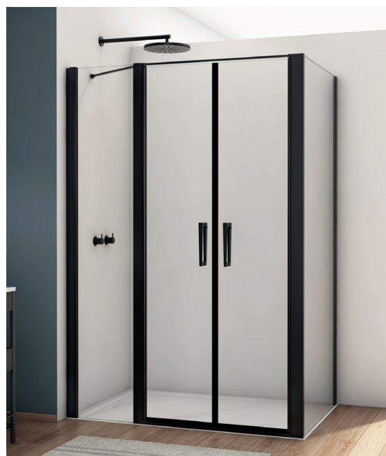
↑ Finition Noir mat