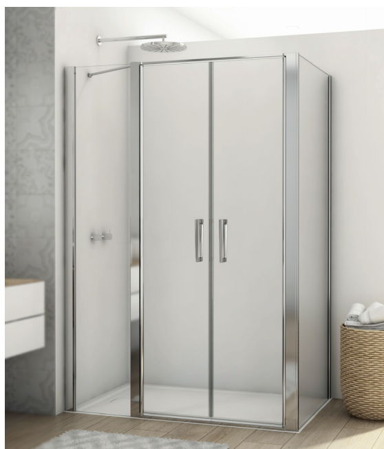
↑ Finition Poli-Brillant