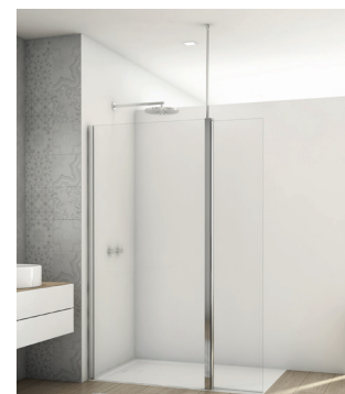
↑ DIVERA Paroi fixe à 90° D22F1 + élément pivotant positionné à 180° D22BTK3 + béquille verticale D22SDK (Poli-brillant)