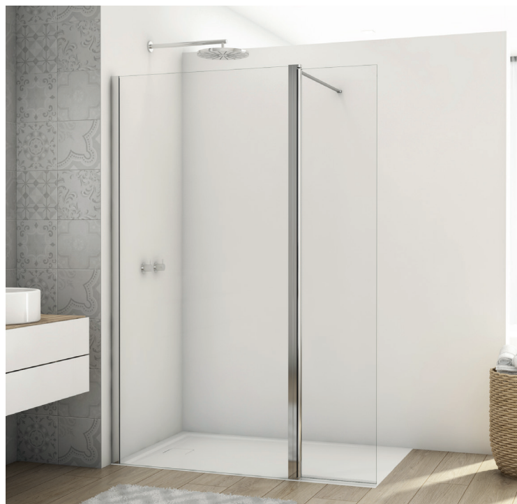
↑ DIVERA Paroi fixe à 90° D22F1 + élément pivotant positionné à 180° D22BTK3 (Poli-brillant)

Livrée avec notice de montage et accessoires