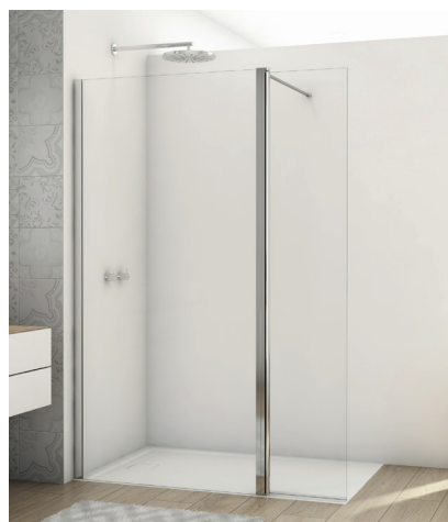
↑ Finition Poli-Brillant