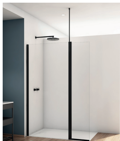
↑ Finition Noir mat