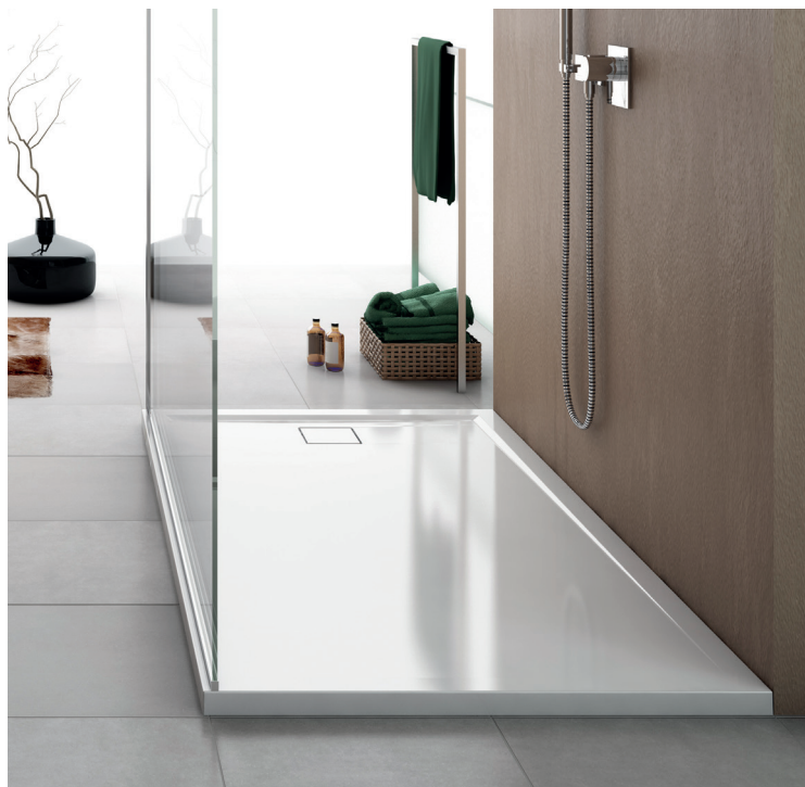
↑ LIVADA Receveur asymétrique, en marbre de synthèse, écoulement sur le côté le plus court W20AS (Finition Blanc brillant)

Résistance à la luminosité Résistance à l'abrasion Résistance aux agents chimiques