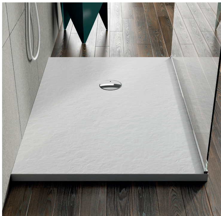
↑ AIR Receveur asymétrique en acrylique W37AS (Finition blanc mat)