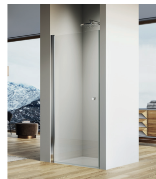
↑ SOLINO Porte pivotante SOL1 (Poli-brillant)