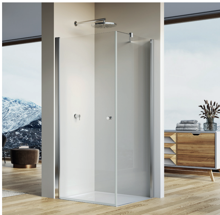
↑ SOLINO Porte pivotante SOL1 + paroi fixe à 90° SOLT1 (Poli-brillant)

Livree avec notice de montage et accessoires