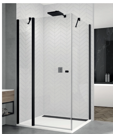
↑ Finition Noir mat