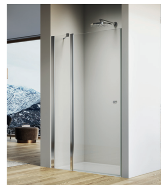
↑ SOLINO Porte pivotante et paroi fixe en ligne SOL13 (Poli-brillant)