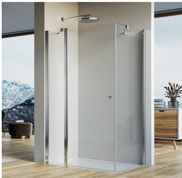
↑ SOLINO Porte pivotante et paroi fixe en ligne SOL13 + paroi fixe à 90° SOLT1 (Poli-brillant)

Livrée avec notice de montage et accessoires