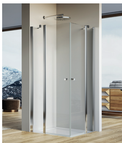
↑ Finition Poli-Brillant