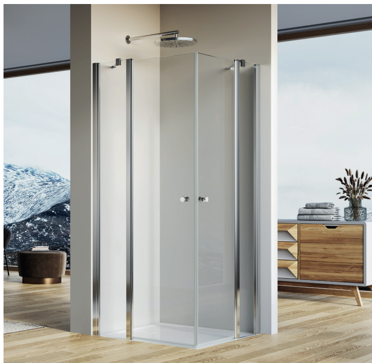
↑ SOLINO Accès d'angle pivotant partiel SOL13 G+D (Poli-brillant)

Livree avec notice de montage et accessoires