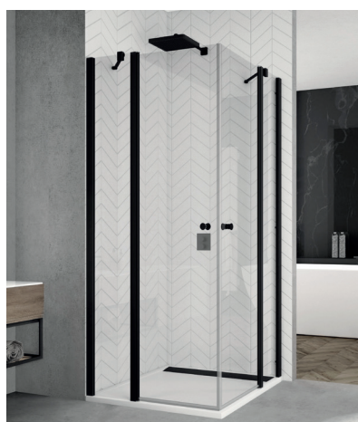
↑ Finition Noir mat