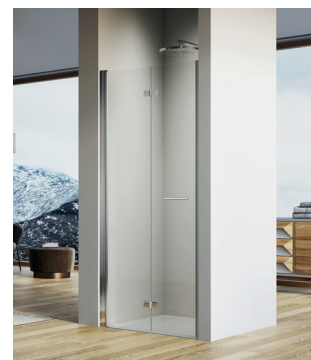
↑ SOLINO Porte repliable SOLF1 (Poli-brillant)