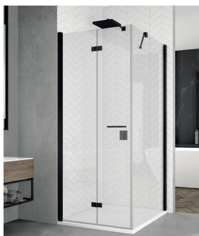
↑ Finition Noir mat