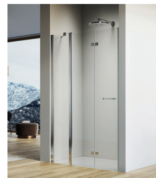
↑ SOLINO Porte repliable et paroi fixe en ligne SOLF13 (Poli-brillant)