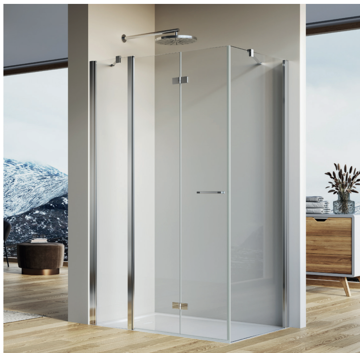
↑ SOLINO Porte repliable et paroi fixe en ligne SOLF13 + paroi fixe à 90° SOLT1 (Poli-brillant)

Livrée avec notice de montage et accessoires