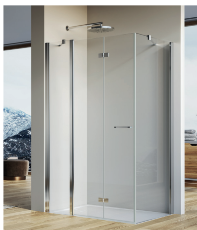
↑ Finition Poli-Brillant