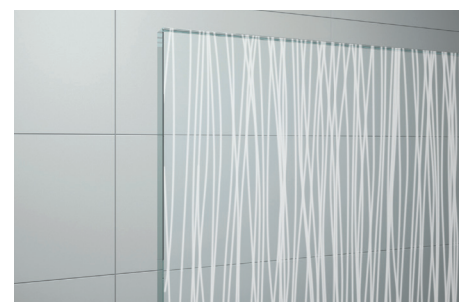
↑ Vitrage Lines