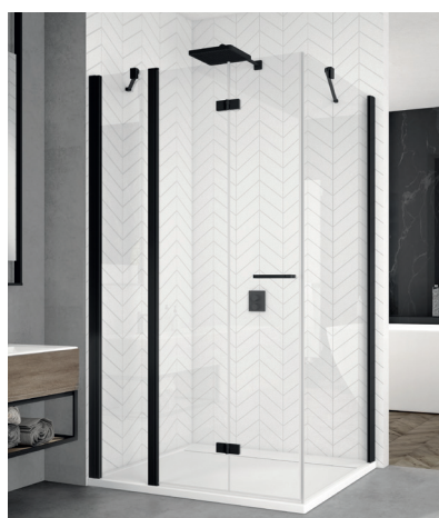
↑ Finition Noir mat