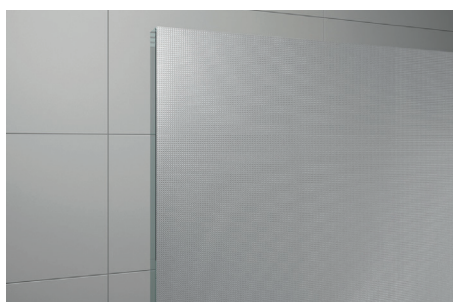
↑ Vitrage Screen