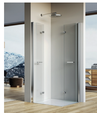
↑ SOLINO Accès d'angle repliable SOLF1 G+D (Poli-brillant)